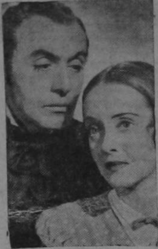
tado con la familia Field, a la cual pertenece Rachel Field, la autora del libro: "El Cielo y Tú".

Lo que más se comenta en relación con el drama: "El Cielo y Tú" ("All this, and heaven too") es que su estreno está llevando una verdadera lluvia de oro a las taquillas de "Music Hall" de Nueva York y a las de los otros teatros donde se está exhibiendo; pero además hay muchos otros detalles de interés, como es el hecho de que tanto el libro como la película están basados en los sucesos que ocurrieron hace un siglo, y que fueron publicados, profusamente ilustrados, en "Las Noticias de Londres", habiéndose tomado de sus páginas muchos de los informes que los Warner utilizaron para dar mayor realismo y realce a "El Cielo y Tú".